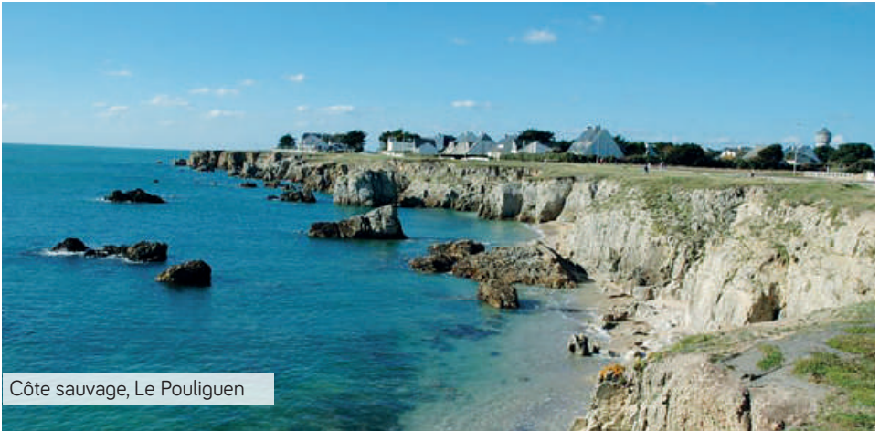
Côte sauvage, Le Pouliguen

4. De 3 à 15 km, Les ports de pêche typiques Les filets de pêche, sa traditionnelle criée, bienvenue à La Turballe et au Croisic. En arrivant tôt vous pourrez observer la valse des chalutiers rentrant au port, puis l'animation qui s'ensuit pour apporter les caisses à la criée. Typical fishing harbours (from 3 to 15 km) Visit La Turballe and Le Croisic with their fishing nets, colourful fishing boats and traditional fish market. Early birds will be able to watch the fishing boats weaving back into port and watch the hustle and bustle as the night's catch is taken to the fish market to be sold. Op 3 tot 15 km afstand, De typische vissersplaatsjes Visnetten, een kleurrijke vloot, de traditionele visveiling... Welkom in La Turballe en in Le Croisic. Als u vroeg bent, kunt u de vissersboten de haven in zien komen en vervolgens de bedrijvigheid rond de veiling bewonderen.