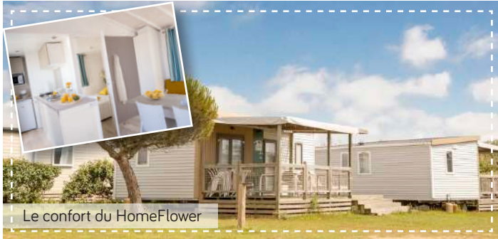
Le confort du HomeFlower

Le camping vous propose des locations de mobil-homes de 1 à 3 chambres, ses Funflowers, Freeflowers et ses cabanes Lodge boisées.