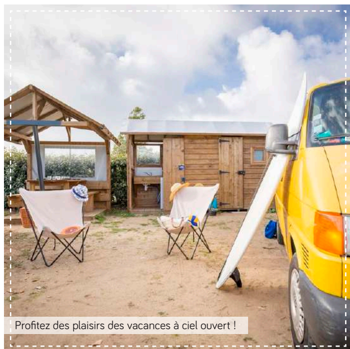
Profitez des plaisirs des vacances à ciel ouvert !

Enjoy the pleasures of an open air holiday! / Genieten van een echte buitenvakantie !