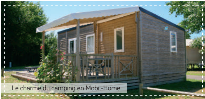
Le charme du camping en Mobil-Home

The charm of HomeFlower camping / Sfeervol kamperen in een HomeFlower